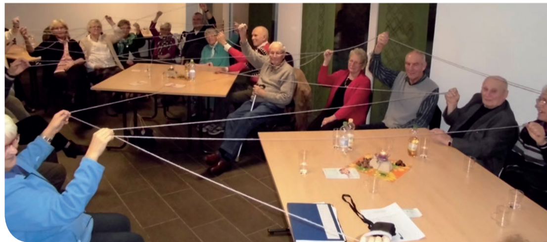
↑ Ein großer Erfolg: Mit Spiel und Spaß auf dem ersten gemeinsamen Abend der Obergrafschaft.

Wir haben jetzt verstärkt Anfragen aus der Niedergrafschaft (Wietmarschen, Emlichheim) erhalten, unseren Verein im Rahmen von Informationsveranstaltungen in den Städten vorzustellen. Genauso kann es nur gehen. Wenn diese Gemeinden die Vorteile unseres Vereins auch für ihre Region erkennen und nutzen wollen, sind wir gerne bereit hierbei unterstützend mitzuwirken. Alle Strukturen zum erfolgreichen Umsetzen haben sich bewährt. Das Rad braucht nicht mehr neu erfunden zu werden. Also stünde einer praktischen Umsetzung nichts mehr im Wege. Wir werden weiter darüber berichten.