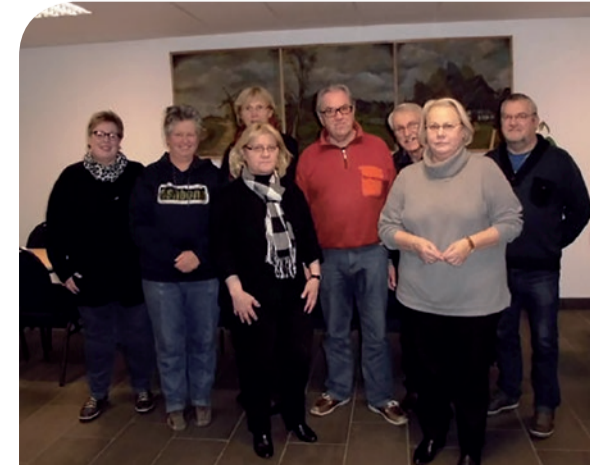
→ Einen Dank an unsere fleißigen Helfer für die Obergrafschaft